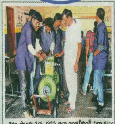
శిక్షణ పొందుతున్న కడప జిల్లా ఇంజనీరింగ్ విద్యార్థులు