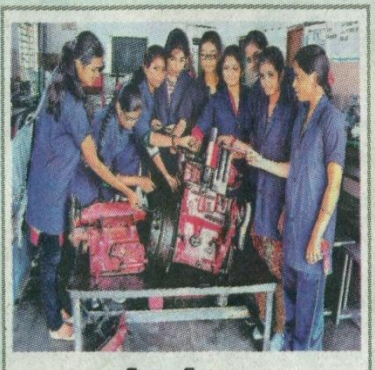
ట్రాక్టర్ ఇంజన్ పరికరాలను పరిశీలిస్తున్న కర్ణాటక విద్యార్థినులు