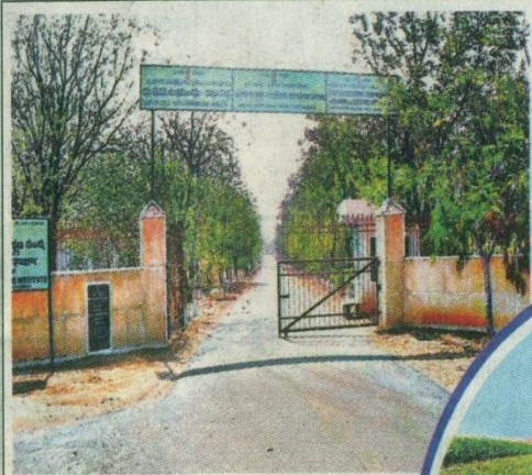
గార్లదినె సమీపంలో ఏర్పాటు చేసిన ట్రాక్టర్ నగర్